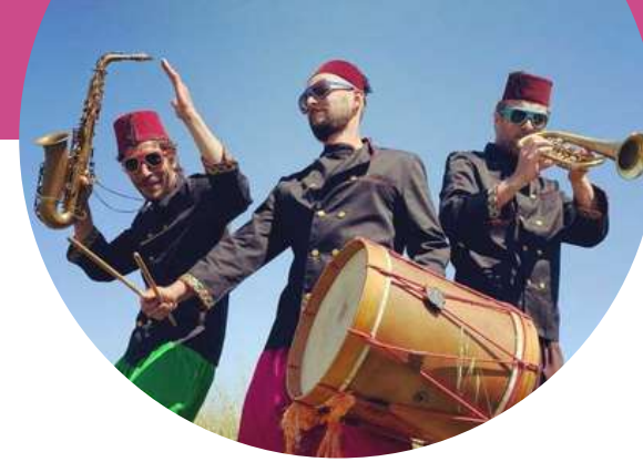
Trío Alcatifa Sonoplastia original

O Trio Alcatifa é composto por três músicos que viajam a bordo de uma sonoridade oriental, numa versão moderna dos lendários tapetes voadores.